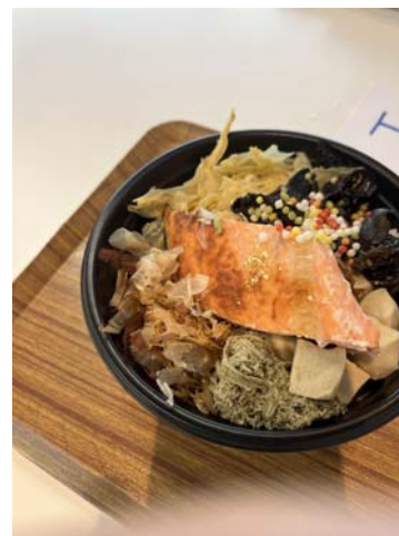
法然房る(ほうねんぼうる)