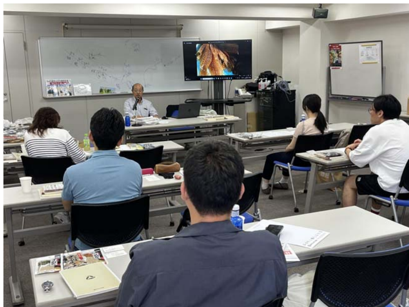
星名先生講義風景

開催場所:全国スーパーマーケット協会(東京都千代田区内神田 3-19-8 櫻井ビル)