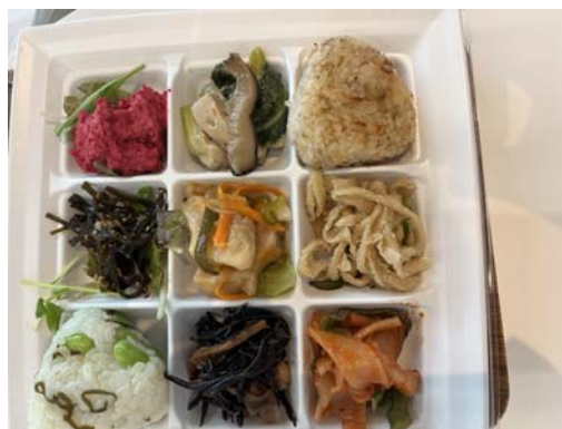
阿弥陀如来す(あみだによらいす)