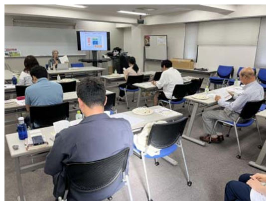
福留先生講義風景