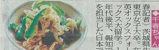
◆肉なし青椒牛肉絲 (チンジャオロースー、1人分)